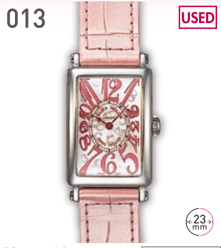
013 USED SS フランクミュラー ロングアイランド 902 QZJ 日本限定500本 定価313.5万円 350,000円 (税込) 紳士 A