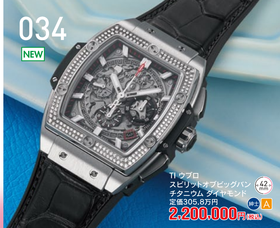
034 NEW TI ウプロ スピリットオブビッグバン チタニウム ダイヤモンド 定価305.8万円 2,200,000円 (税込) 紳士 A