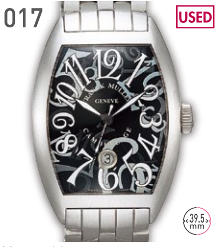
017 USED SS フランクミュラー カザブランカ カモフラージュ 8880 C DT BR 参考定価140万円(税抜) 630,000円 (税込) 紳士 A