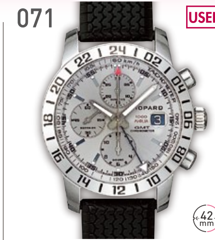
071 USED SS ショパール ミルレミア GMT クロノグラフ 定価113.3万円 380,000円 (税込) 紳士 A