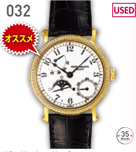
032 USED おすすめ YG バテックフィリップ ブチコンプリケーション 5015J 参考定価331.8万円 1,980,000円 (税込) 紳士 A