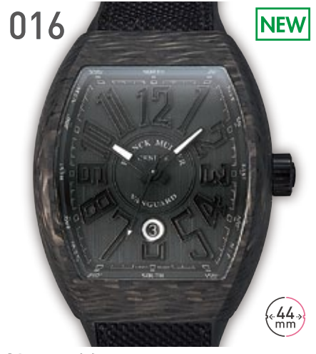
016 NEW CA フランクミュラー ヴァンガード V45 SCDT 定価176万円 850,000円 (税込) 紳士 A