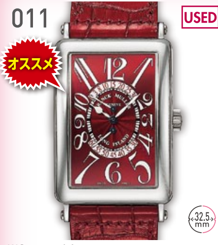
011 USED おすすめ WG フランクミュラー ロングアイランド ビーレトロ 1100 DSR 定価324.5万円 898,000円 (税込) 紳士 A