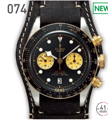
074 NEW S/Y チューダー ブラックベイ クロノグラフ プレミアム商品 定価113.3万円 625,000円 (税込) 紳士 A