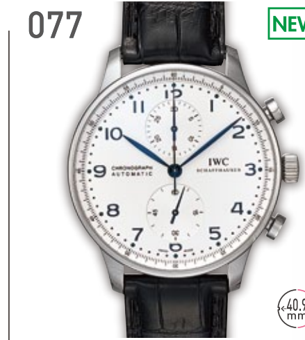
077 NEW SS IWC ボルトギアゼ クロノグラフ 定価77万円 740,000円 (税込) 紳士 A