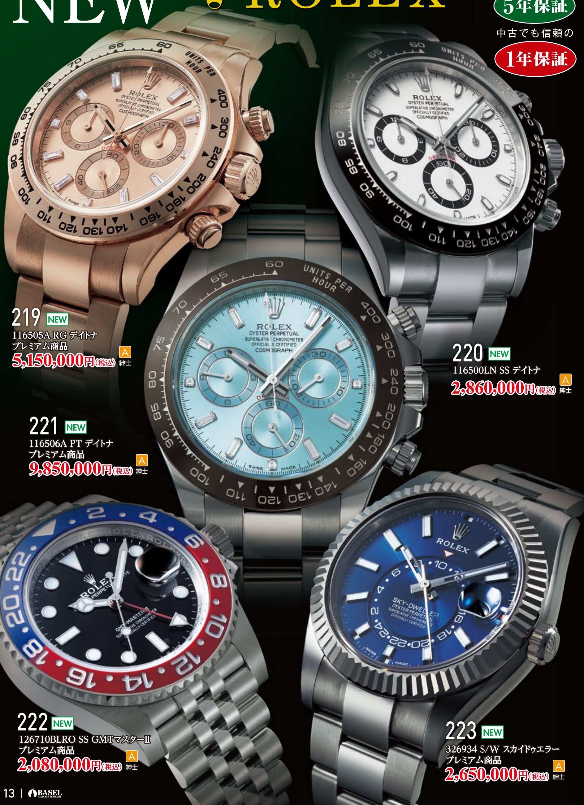
219 NEW 116505A RG デイトナ プレミアム商品 5,150,000円(税込) 紳士