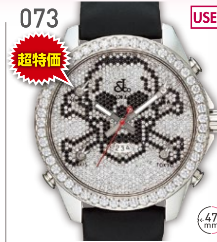
073 USED 超特価 SS ジェイコブ 5タイムゾーン スカル 定価77万円 880,000円 (税込) 紳士 Q