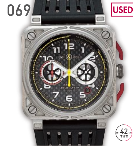
069 USED T1 ベル&ロス ルノー クロノグラフ 世界限定999本 定価88.56万円 450,000円 (税込) 紳士 A