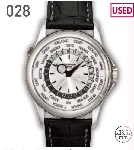
028 USED WG バテックフィリップ ワールドタイム 5130G-001 定価543.4万円 3,450,000円 (税込) 紳士 A