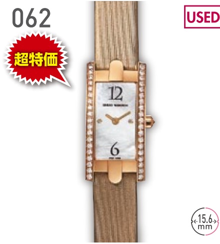
062 USED 超特価 RG ハリーウィンストン アヴェニューC ミニ 定価203.5万円 898,000円 (税込) 紳士 Q