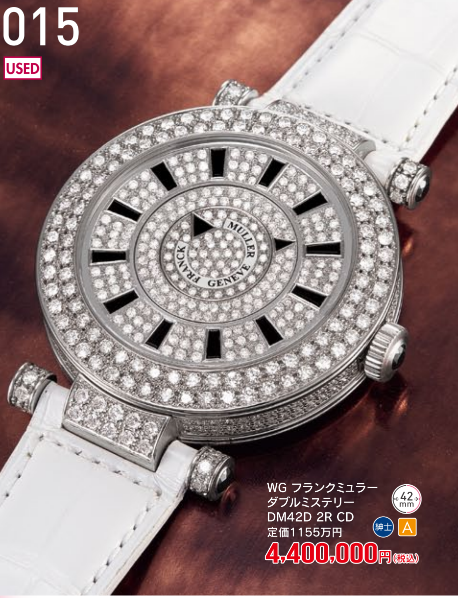
015 USED WG フランクミュラー ダブルミステリー DM42D 2R CD 定価1155万円 4,400,000円 (税込) 紳士 A