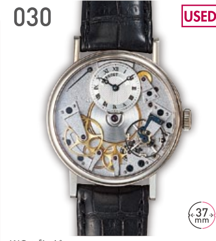
030 USED WG プレゲ トラディション 定価204万円 1,780,000円 (税込) 紳士 A