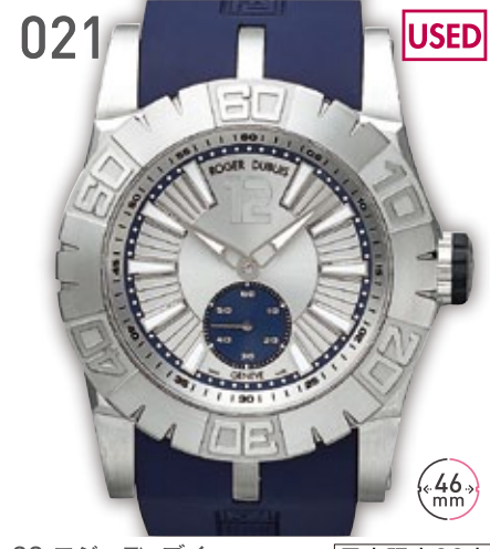
021 USED SS ロジェデュブイ イージーダイバー 日本限定88本 参考定価150万円(税抜) 670,000円 (税込) 紳士 A