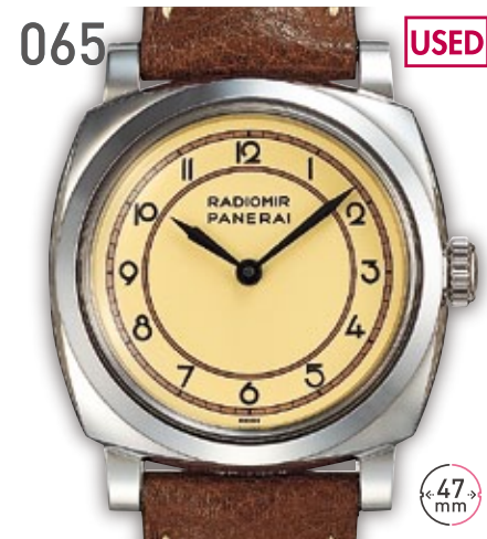
065 USED SS パネライ ラジオミール 3デイズ アッチャイオ PAM00791 参考定価110万円 880,000円 (税込) 紳士 M