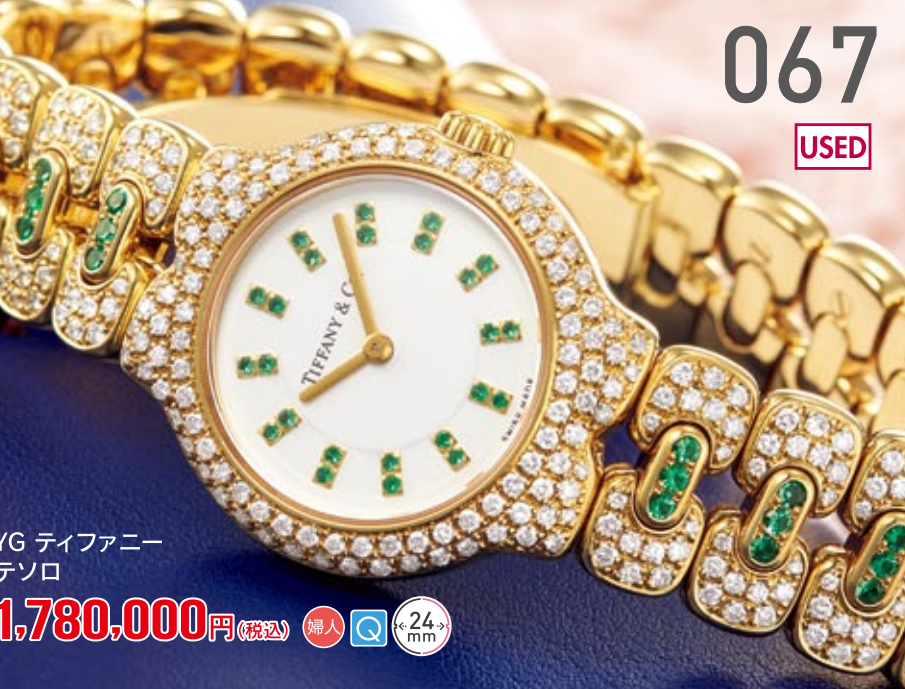
067 USED YG ティファニー テソロ 定価266.2万円 1,780,000円 (税込) 紳士 Q 24mm