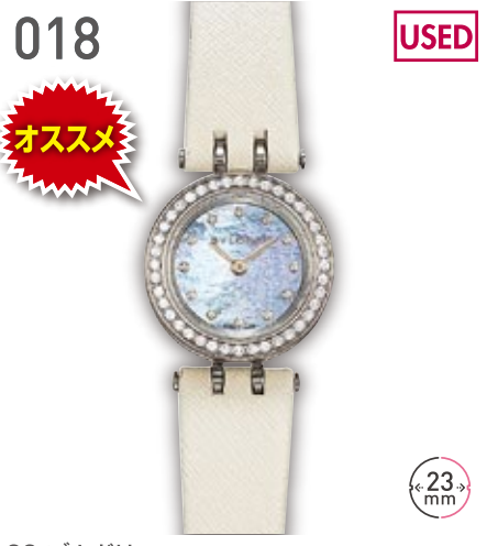
018 USED おすすめ SS ブルガリ B zero 1 定価59.4万円 280,000円 (税込) 紳士 A