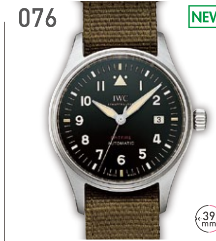
076 NEW SS IWC パイロットウォッチ スピットファイア 定価59.4万円 498,000円 (税込) 紳士 A