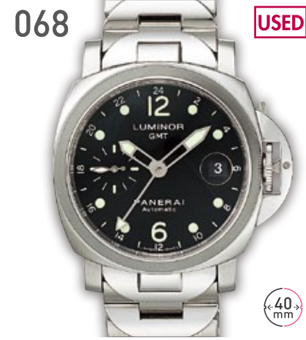
068 USED SS パネライ ルミノール GMT PAM00160 参考定価72.36万円 530,000円 (税込) 紳士 A