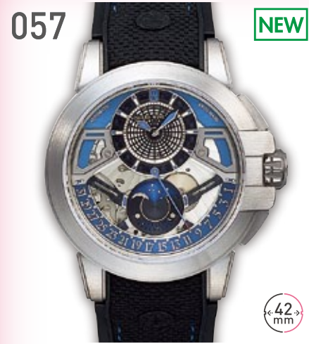
057 NEW ZA ハリーウィンストン オーシャンプロジェクト Z13 定価297万円 2,180,000円 (税込) 紳士 A