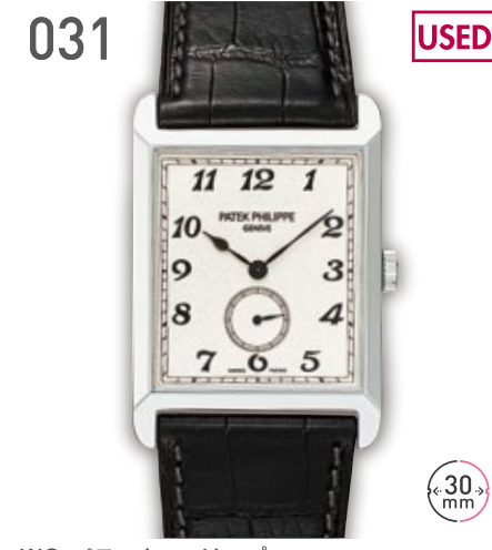
031 USED WG バテックフィリップ ゴンドーロ 5109G 参考定価204万円 1,580,000円 (税込) 紳士 M