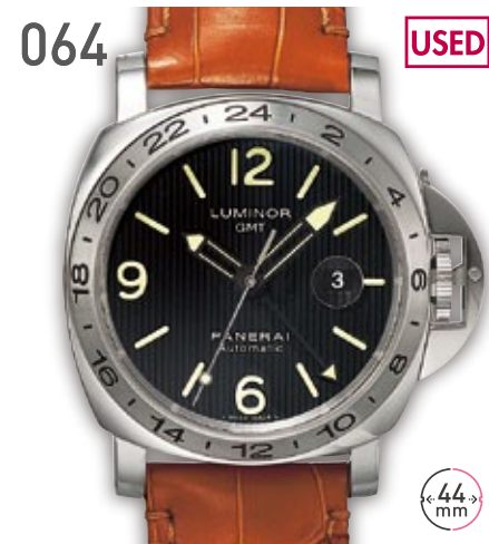
064 USED SS パネライ ルミノール GMT フリンケ PAM00029 参考定価74.52万円 580,000円 (税込) 紳士 A