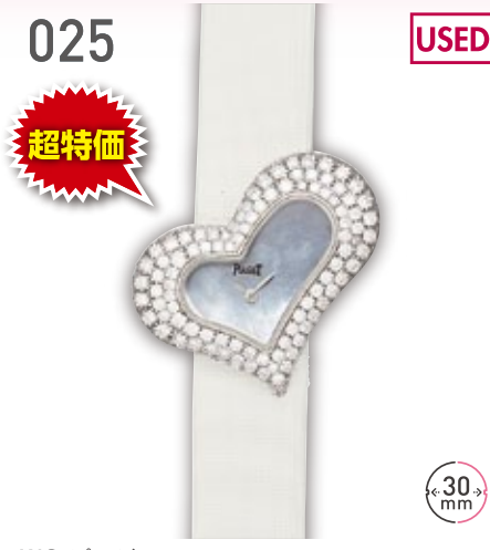
025 USED 超特価 WG ピアジェ ライムライトハート 定価575.3万円 1,580,000円 (税込) 紳士 A