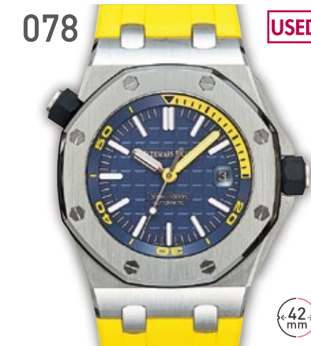
078 USED SS オーデマピゲ ロイヤルオーク オフショア ダイバー 定価231万円 2,180,000円 (税込) 紳士 A