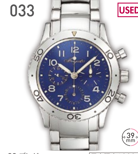
033 USED SS プレゲ アエロナバル 日本限定1000本 定価310万円(税抜) 680,000円 (税込) 紳士 A