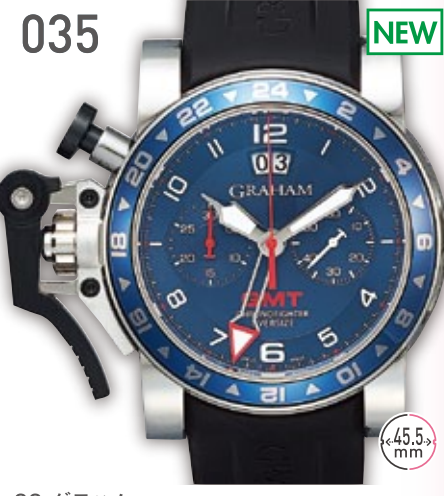
035 NEW SS グラハム クロノファイター オーバーサイズGMT 定価114.48万円 498,000円 (税込) 紳士 A