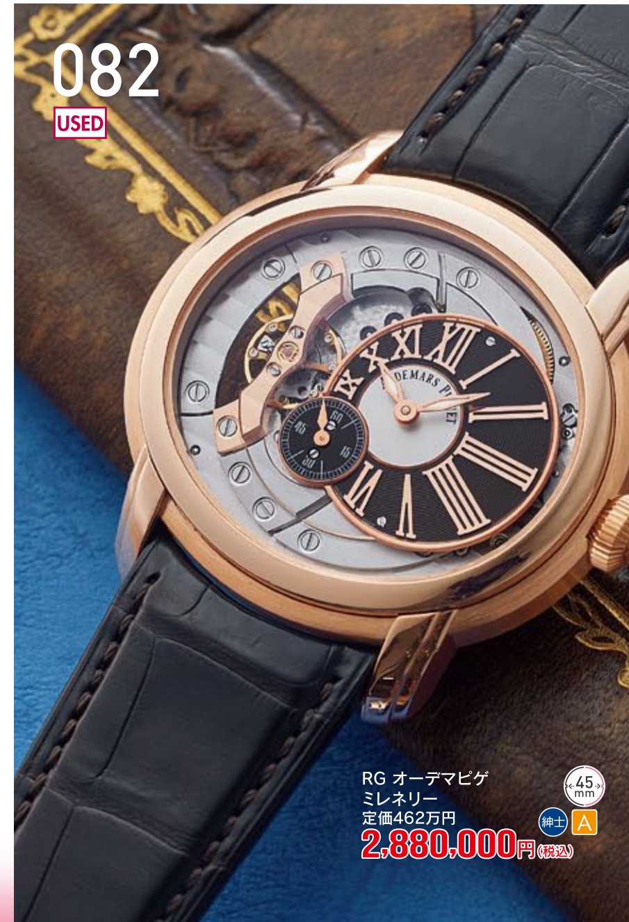
082 USED RG オーデマピゲ ミレナリー 定価462万円 2,880,000円 (税込) 紳士 A 45mm