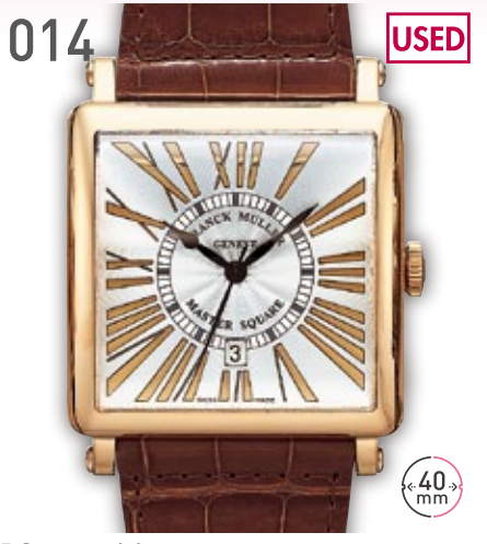
014 USED RG フランクミュラー マスタースクエア 6000K SC DT 定価313.5万円 980,000円 (税込) 紳士 A