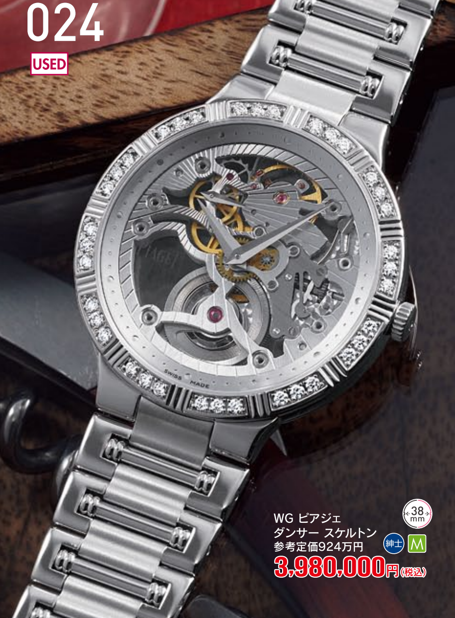
024 USED WG ピアジェ ダンサー スケルトン 参考定価924万円 3,980,000円 (税込) 紳士 M