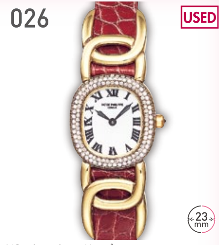
026 USED YG バテックフィリップ ゴールデンエリプス 4831J-001 定価543.4万円 1,250,000円 (税込) 紳士 A