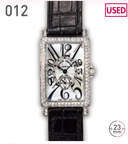
012 USED WG フランクミュラー ロングアイランド 900 S6D 定価357.5万円 790,000円 (税込) 紳士 A