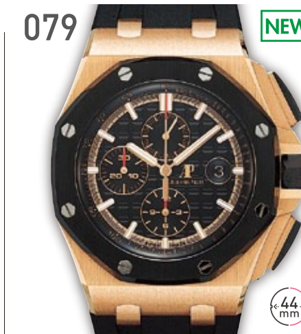
079 NEW RG オーデマピゲ ロイヤルオーク オフショア クロノグラフ 定価528万円 4,950,000円 (税込) 紳士 A