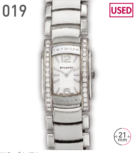
019 USED WG ブルガリ アショーマD 定価133万円(税抜) 530,000円 (税込) 紳士 A