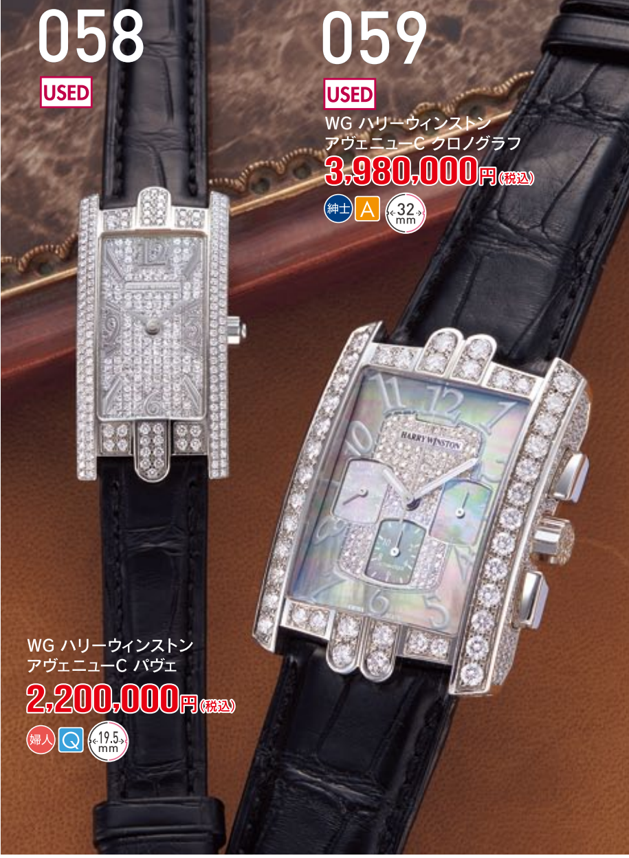
058 USED 059 USED WG ハリーウィンストン アヴェニューC クロノグラフ 3,980,000円 (税込) 紳士 A 32mm WG ハリーウィンストン アヴェニューC パヴェ 2,200,000円 (税込) 紳士 Q 19.5mm