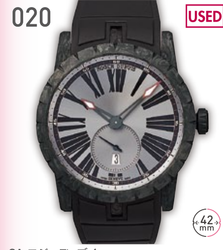
020 USED CA ロジェデュブイ エクスカリバー42 定価187万円 1,100,000円 (税込) 紳士 A