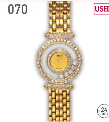
070 USED YG ショパール ハッピーダイヤモンド 定価113.3万円 798,000円 (税込) 紳士 Q