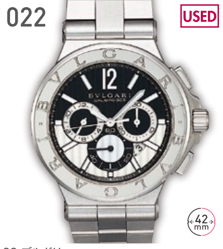
022 USED SS ブルガリ ディアゴノ カリプロ 303 参考定価133万円(税抜) 480,000円 (税込) 紳士 A