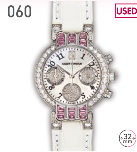
060 USED WG ハリーウィンストン プリミエール クロノグラフ 定価203.5万円 2,380,000円 (税込) 紳士 Q