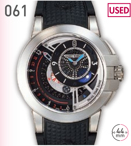
061 USED ZA ハリーウィンストン オーシャンプロジェクト Z8 定価258.5万円 1,380,000円 (税込) 紳士 A