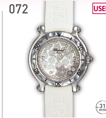
072 USED SS ショパール ハッピースノーフレーク 定価59.4万円 270,000円 (税込) 紳士 Q