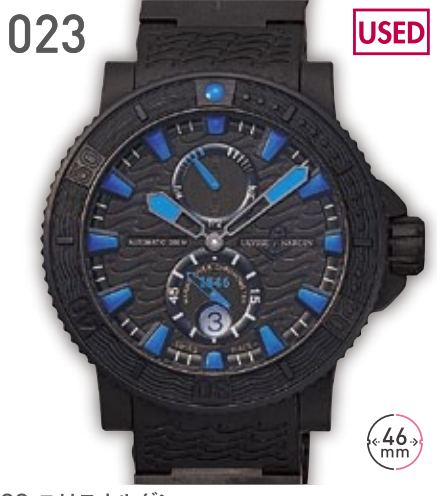
023 USED SS ユリスナルダン マリンダイバー ブラックシー 参考定価121万円 480,000円 (税込) 紳士 A