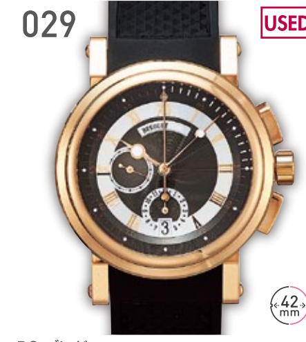
029 USED RG プレゲ マリンII クロノグラフ 参考定価310万円(税抜) 2,350,000円 (税込) 紳士 A