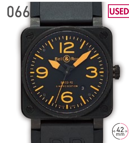
066 USED SS ベル&ロス BR03-92 世界限定250本 定価110万円 250,000円 (税込) 紳士 A