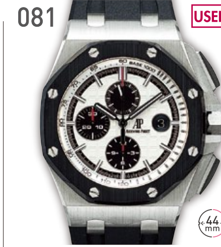
081 USED S/C オーデマピゲ ロイヤルオーク オフショア クロノグラフ 定価361.8万円 2,980,000円 (税込) 紳士 A