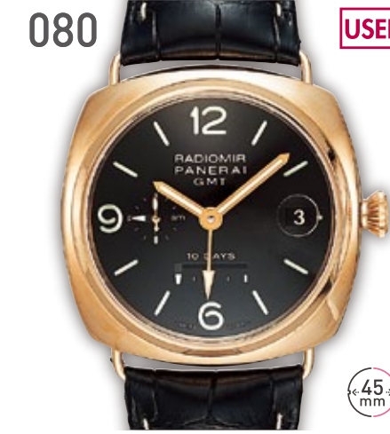
080 USED RG パネライ ラジオミール 10デイズ GMT PAM00273 定価322.3万円 1,750,000円 (税込) 紳士 A