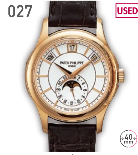
027 USED RG バテックフィリップ アニュアルカレンダー 5205R-001 定価575.3万円 4,700,000円 (税込) 紳士 A