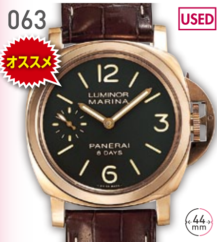
063 USED オススメ RG パネライ ルミノール マリーナ 8デイズ オロロツ PAM00511 定価266.2万円 1,750,000円 (税込) 紳士 M